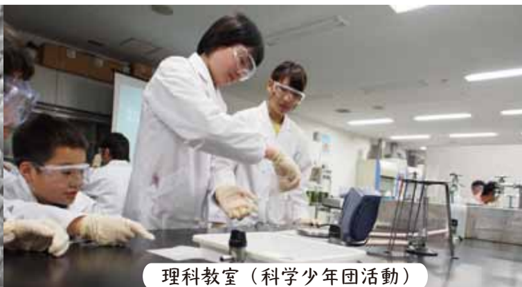
理科教室(科学少年団活動)