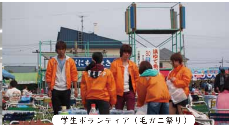
学生ボランティア(毛ガニ祭り)